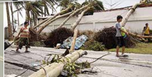
Ayuda entre las víctimas del tifón