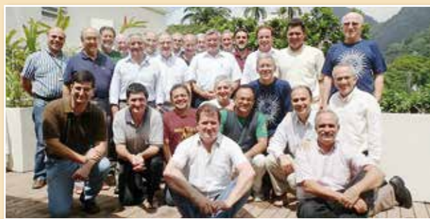
27ª Asamblea General

Mientras los jesuitas en Filipinas continúan repartiendo ayuda entre las víctimas del tifón Yolanda, los investigadores en la universidad de la Compañía en la ciudad de Davao (Filipinas Meridional) están estudiando cómo crear un equipo que ayude a la gente a sobrevivir durante más tiempo cuando en el futuro ocurran calamidades como las de ahora. Aprovechando la experiencia acumulada durante este tifón y otros acontecimientos similares del pasado, la Facultad de Ingeniería del Ateneo en la Universidad de Davao ha fabricado un equipo de subsistencia que incluye una lámpara de energía solar, un cargador para el móvil y una depuradora de agua. La agencia local de socorro que han creado los jesuitas en las Filipinas, Simbahang Lingkod ng Bayan (SLB), ha utilizado el Ateneo de Davao University y otros centros escolares como puntos de recogida y distribución de la ayuda conseguida.