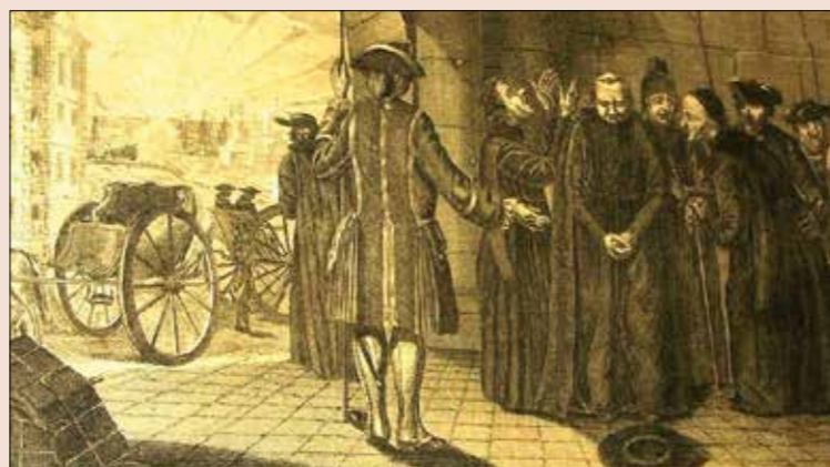
Escena de la expulsión de un colegio.

Para muchos jesuitas era su primera navegación y algunos veían el mar por primera vez, sin poder acostumbrarse a los mareos. Después de un viaje de varias semanas según las distintas distancias recorridas, fueron arribando al puerto de Civitavecchia, cerca de Roma, donde Carlos III había decidido desembarcarlos. Pero allí se encontraron con la nega-