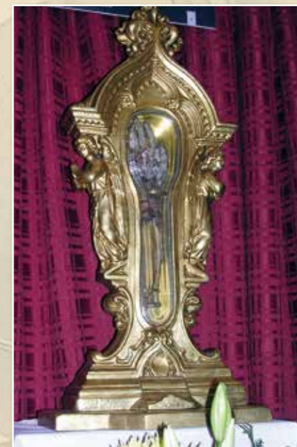
Brazo de S. Francisco Javier