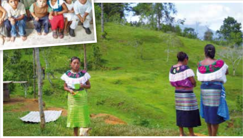
Índigenas de Chiapas. Mujeres de la comunidad Santa Fe del Duraznal, misión de Bachajón

desde la introducción del agua potable, el alumbrado público o